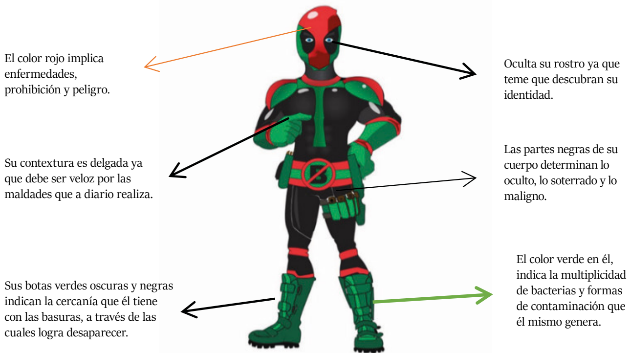
Figura 2. Diseño del personaje antagonista Mister Bacteria.

Bio-Woman: La heroína BioWoman (ver Figura 1) representa los ideales de orden y limpieza. BioWoman es triunfadora, fuerte, limpia y trabajadora y se asume como la encargada de proteger el planeta. Sus superpoderes son cuatro: 1) Vuela; 2) Es muy veloz; 3) Teletransporta basura al lugar en el que debe estar, y 4) Con los rayos de sus ojos comprime y destruye los residuos, y con su aguda visión logra encontrar las basuras que los niños esconden. BioWoman hace referencia al arquetipo del héroe (Campbell, 2014) y se configura como una imagen de poder; su deber es luchar contra el desorden generado por las basuras.