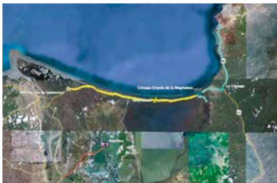
Turismo de naturaleza https://turismomagdalena.wordpress.com/cienaga/

Según el Centro Nacional de Memoria Histórica (2014) durante los periodos comprendidos entre 1998 y el 2005, la región Caribe y en especial el departamento del Magdalena se vieron sometidos a uno de los repertorios más críticos de violencia en la historia del conflicto armado en el país. En estos hechos se han perpetrado un sinnúmero de crímenes de lesa humanidad contra la población civil, siendo las masacres unas de las principales estrategias de los grupos alzados en armas contra las comunidades de la región. En la región de la Ciénega Grande de Santa Marta en noviembre de 2000, un grupo armado ilegal irrumpió en horas de la madrugada en la comunidad de Nueva Venecia, población palafítica y asesinaron a 39 pescadores.